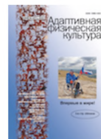
№ 3 (91)