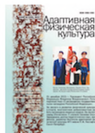
№ 2 (90)