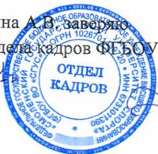
Зуенко Зоя Тихоновна