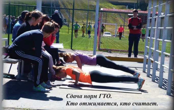
Сдача норм ГТО. Кто отжимается, кто считает.