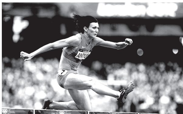
Наталья Антюх в Лондоне.