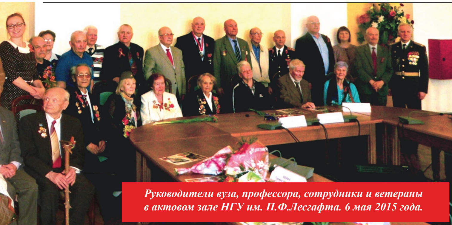
Руководители вуза, профессора, сотрудники и ветераны в актовом зале НГУ им. П.Ф.Лесгафта. 6 мая 2015 года.