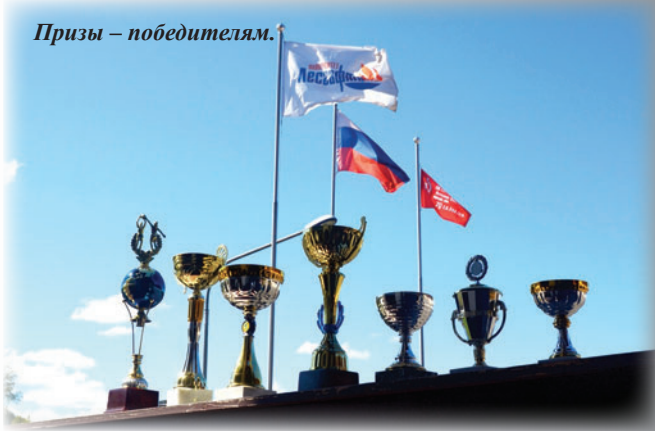
Призы – победителям.