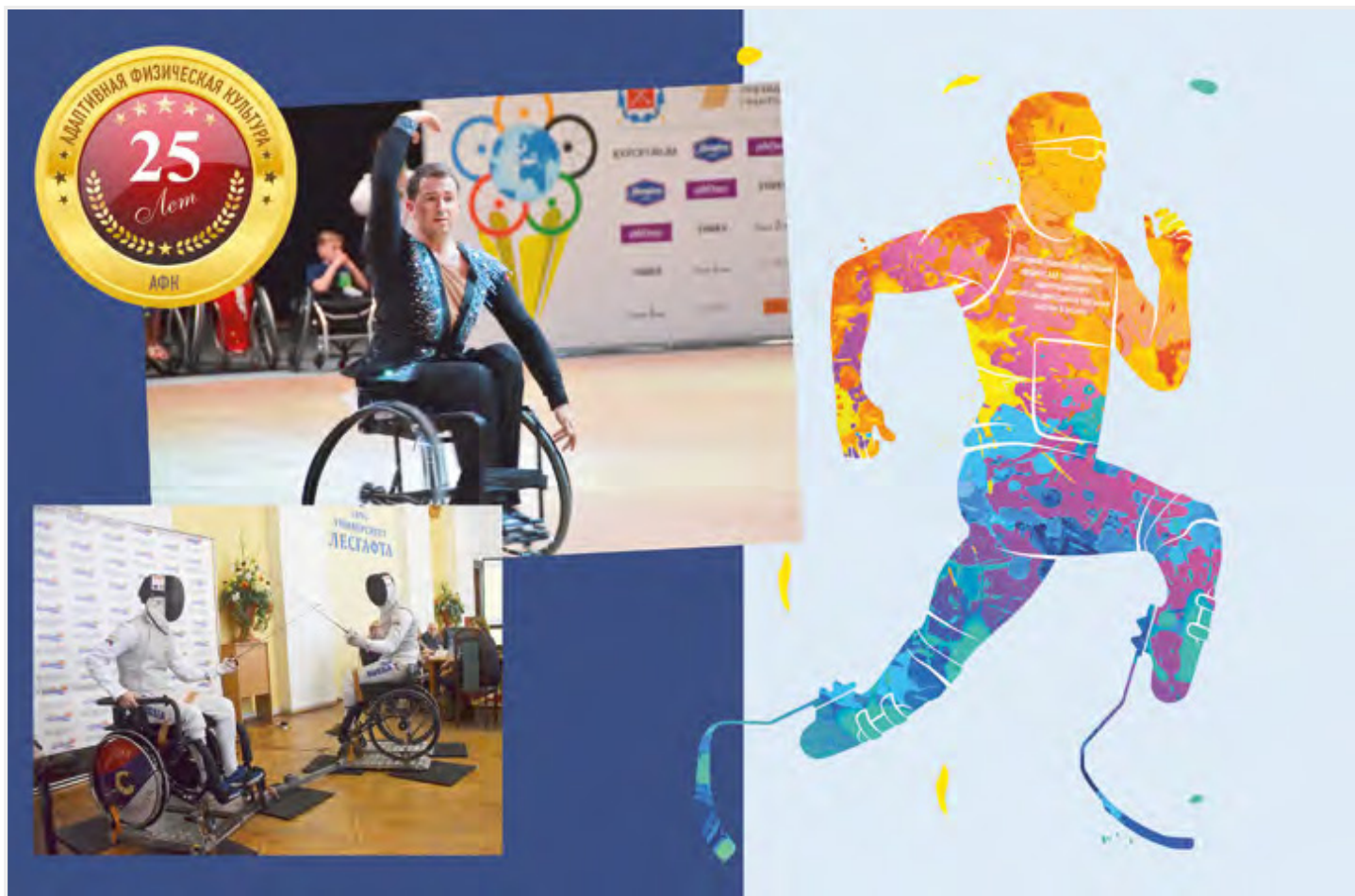
Коллаж Уршулы Кузьма.

Международный научный конгресс, приуроченный к 25-летию кафедры теории и методики адаптивной физической культуры (ТиМ АФК), показал перспективы этого направления и позволил обозначить его главные проблемы.