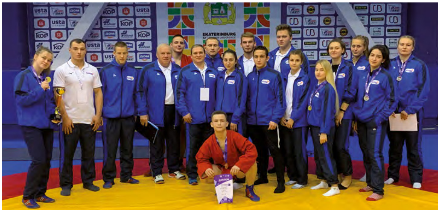
Спортсмены и сотрудники кафедры теории и методики борьбы

Кафедра теории и методики борьбы с 1976 года собирает таланты, которые успешно представляют наш вуз и сборную России на международных и внутренних первенствах. Кафедра готовит спортсменов и тренеров по самбо, дзюдо, греко-римской и вольной борьбе, постоянно совершенствуя теорию и методику спортивной борьбы.