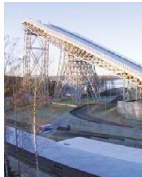
университету как вузу исполнится 125 лет, а в 2022 году — 150 лет как учебному заведению. Все соревнования, которые будут проходить в течение года, будут посвящены юбилейным датам. В течение года мы будем проводить мероприятия, связанные с историей университета, рассказывать о тех, кто делал историю альма-матер.

— Каковы ваши пожелания читателям газеты «Лесгафтовец» и всем, кто любит наш университет?