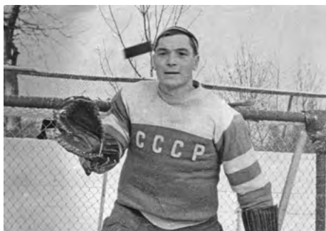
На фото Н.Г. Пучков

водством национальная команда стала чемпионом мира в 1973-м и 1974 годах и впервые сыграла серию матчей против канадских профессионалов в легендарной суперсерии 1972 года.