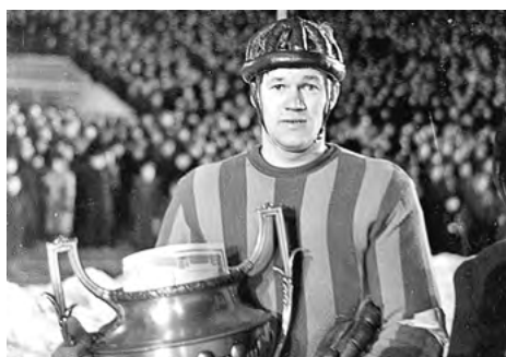
На фото В.М. Бобров

Всеволод Михайлович Бобров — чемпион мира по хоккею с шайбой (дважды — в качестве игрока и дважды — в качестве тренера), трижды становился чемпионом Европы, единственный в истории спорта капитан олимпийских сборных СССР по футболу (Хельсинки, 1952 год) и по хоккею с шайбой (Кортин д'Ампеццо, 1956 год).