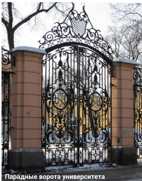
Парадные ворота университета

В июле того же года предстояло бракосочетание великого князя Александра Михайловича с великой княжной Ксенией Александровной, дочерью императора Александра III (сестрой Николая II). Особняк на Мойке был преподнесен молодоже-