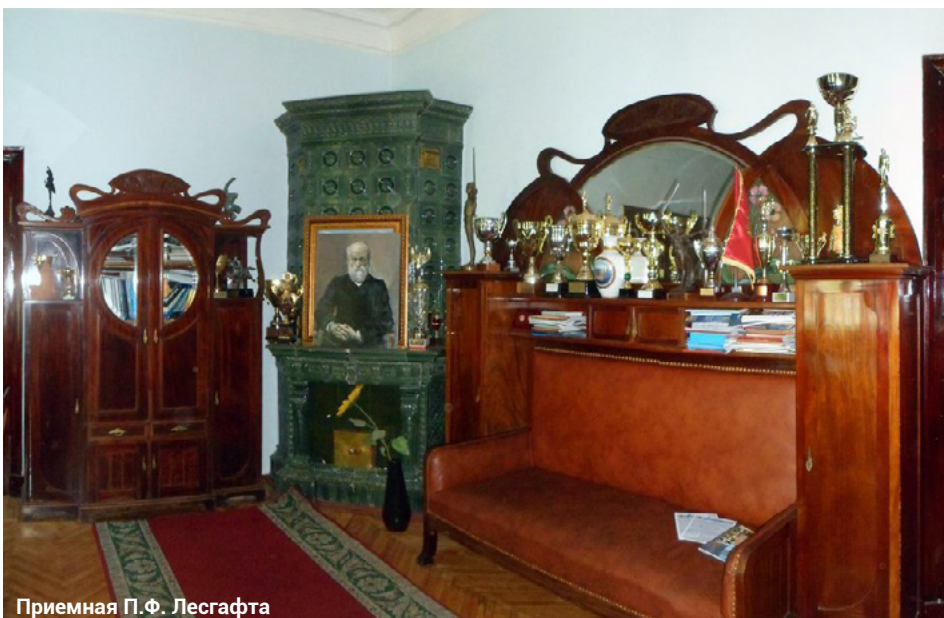
Приемная П.Ф. Лесгафта

По материалам очерка Лариссы Бройтман «Особняк на Мойке, 106»