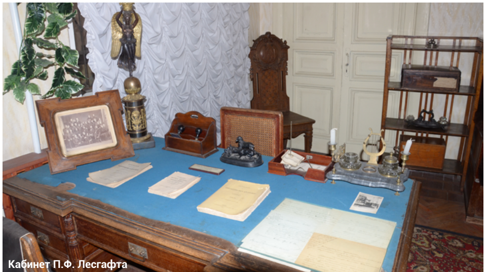
Кабинет П.Ф. Лесгафта