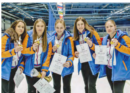
Женская команда по кёрлингу

В этой тяжелой и захватывающей борьбе команда Университета имени П.Ф. Лесгафта проявила высокое мастерство, мужество и характер. Наши студенты кафедры теории и методики конькобежного спорта и фигурного катания сумели обыграть сильных соперников и занять 3 общекомандное место.