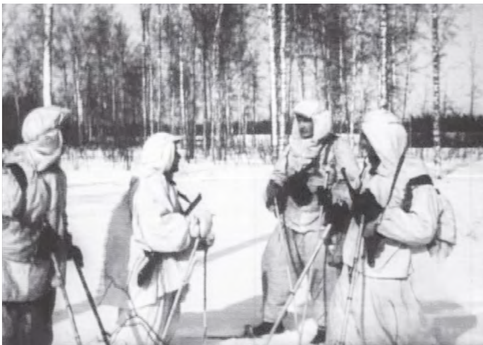
Бойцы-лыжники в маскхалатах. Их почти не различить на снегу.

огневой точки большая. Финский пулеметчик не может поразить наших залегших солдат, но и они не могут идти в атаку, так как, поднявшись, попадут под шквальный огонь. Так и лежат в своих темных тонких шинелях и буденовках на снегу, замерзают.