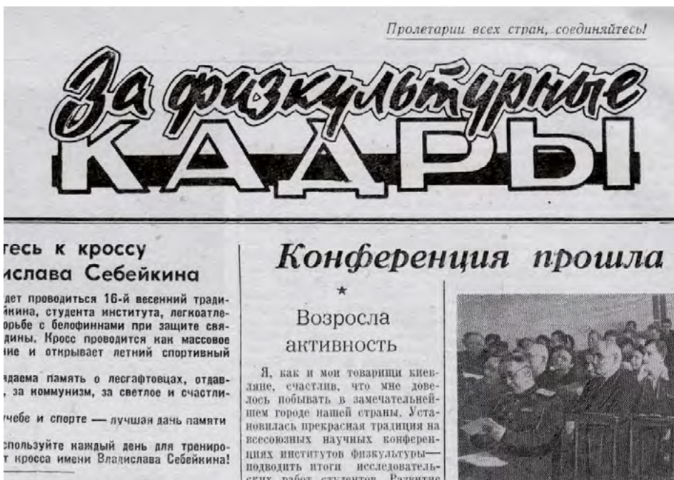
Газета «За физкультурные кадры», 1957 год.

В текстах нет излишней политизированности, стремления дублировать «идеологически правильные»