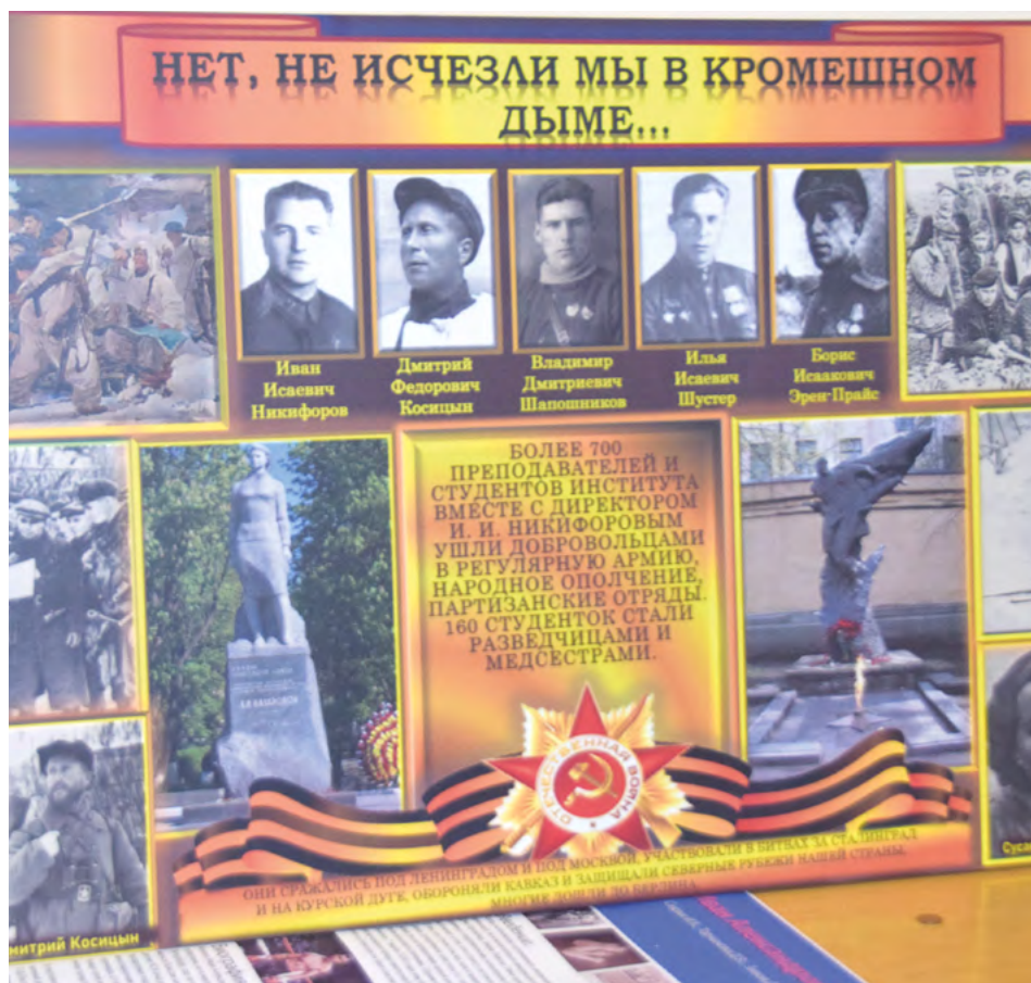
Первое место.

Финальный этап конкурса «Спортсмены — участники Великой Отечественной войны» прошел 27 марта в формате видеоконференции. Студенты и аспиранты нашего университета представили стендовые доклады и информационные плакаты, посвященные юбилею Победы.