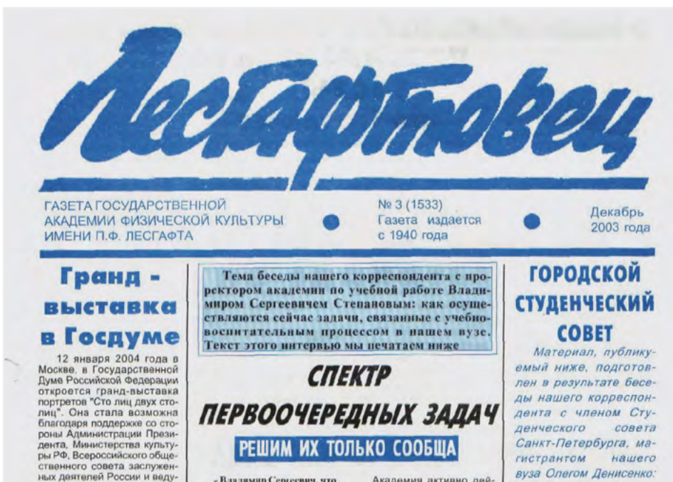
Первый цветной номер газеты «Лесгафтовец» от 15 декабря 2003 года.