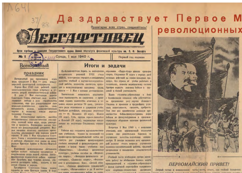
Первый номер «Лесгафтовца» от 1 мая 1940 года.

Весна-2020 — юбилейная для нашей газеты. В этом году «Лесгафтовцу» исполнилось 80 лет. Переживая разные эпохи, фиксируя кадры истории старейшего физкультурного вуза в Европе, издание меняется, но остается молодым.