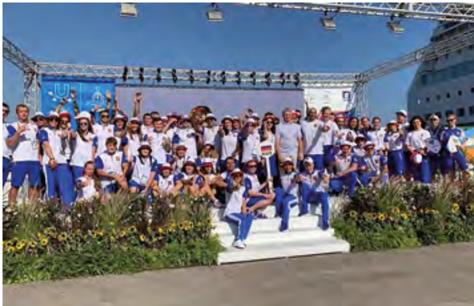
Глава Минспорта России Павел Колобков со сборной командой России.