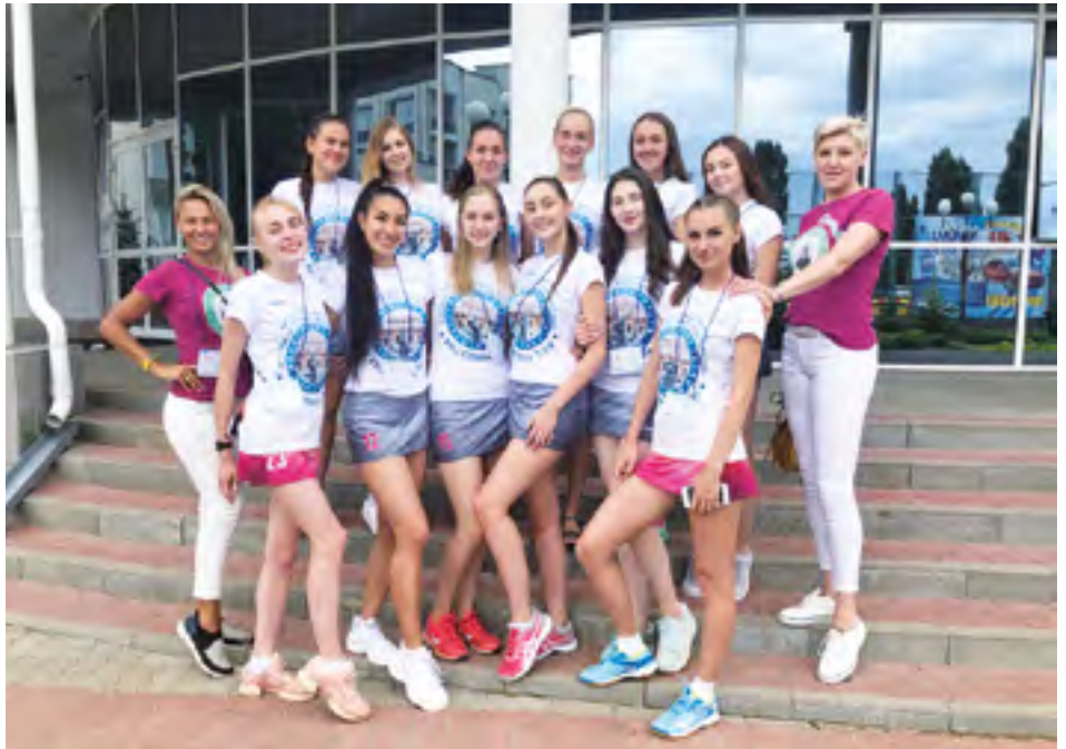
Женская волейбольная команда.

С таким названием уже восемь лет выступает мужская хоккейная команда. Ребята являются шестикратными чемпионами Санкт-Петербурга. По словам менеджера