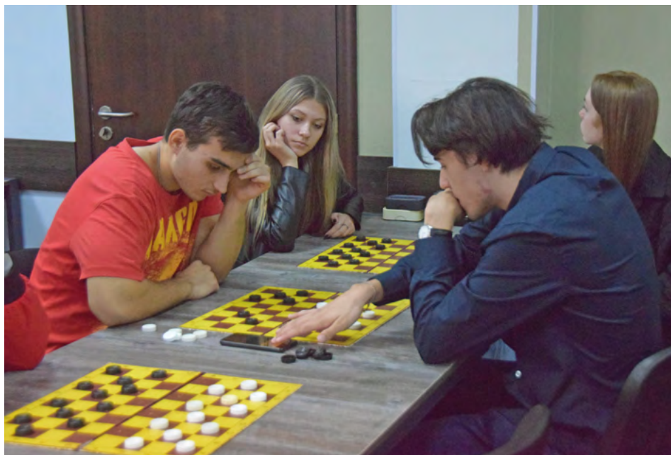
Турнир по шашкам.