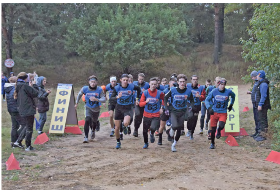
«Забег сильнейших».

Турнир по баскетболу 3х3 среди женских команд факультетов Университета Лесгафта завершился победой команды ИМиСТ, на втором