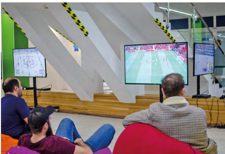
Турнир по киберспорту.