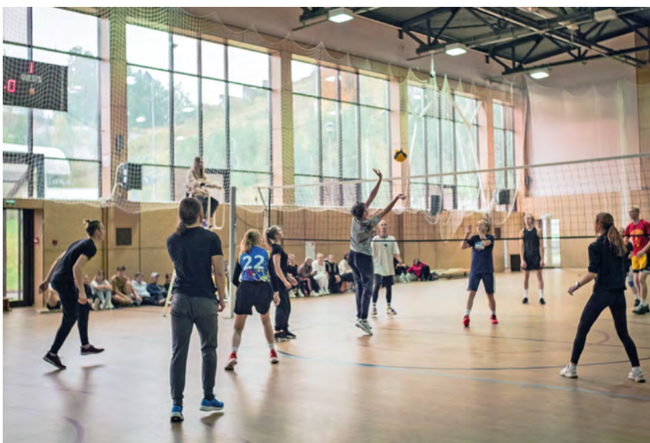
Турнир по волейболу.

1 место – ИМИСТ 2 место – ИАФК 3 место – ФЛОВС