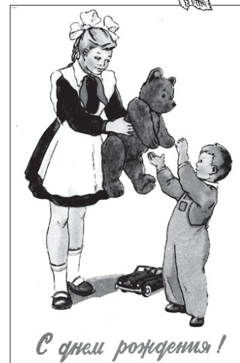
Девочка с медведем. Открытка выпущена в СССР в 1956 г. Художник Сергей Алексеевич Куприянов (род. 1928).