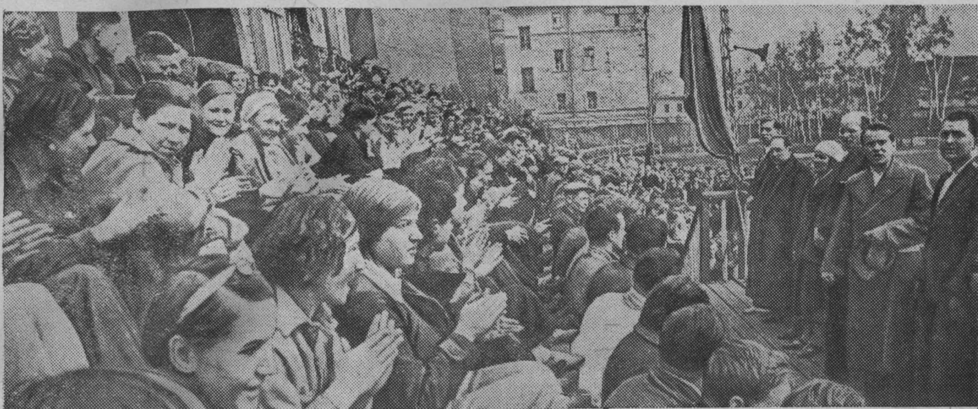
На митинге, посвященном награждению студентов-лыжников