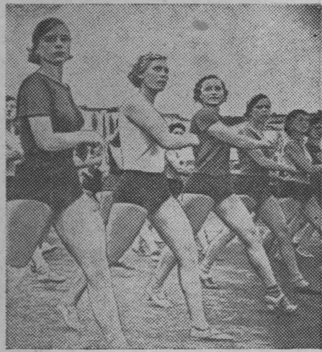
Прохождение женской сдти строевым шагом.