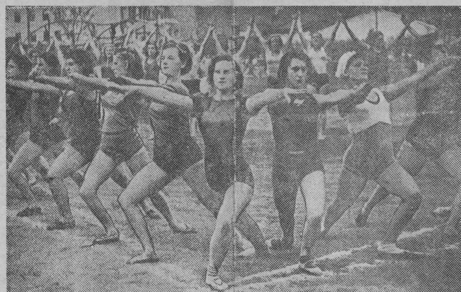
Центральная группа вольных упражнений