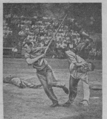
Эпизод рукопашного боя.

Учти свои мельчайшие ошибки, мобилизав внимание и волю, можно выступить на «отлично». П. САХАРОВ