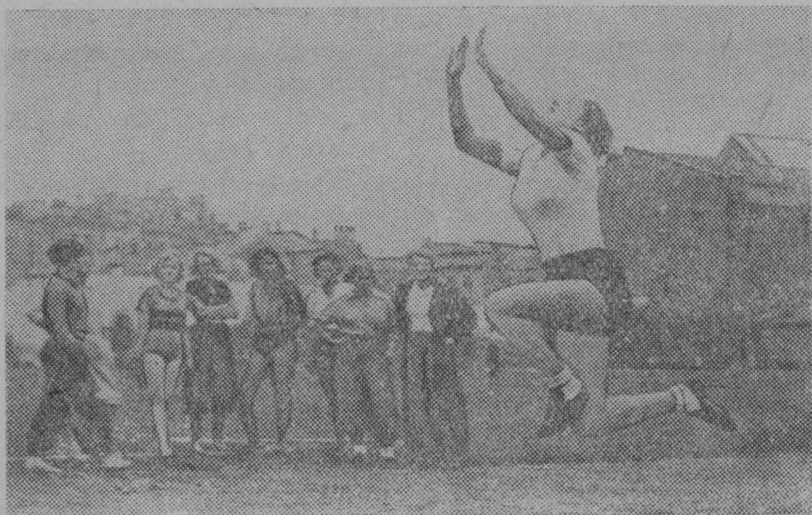
На приемных экзаменах по легкой атлетике.