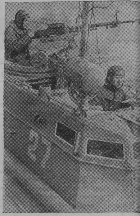
Учеба Краснознаменного Балтийского флота. На снимке: торпедный катер выходит на боевой курс для выполнения задания по стрелковой подготовке.