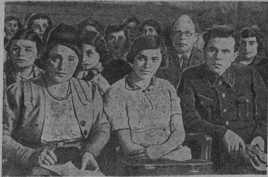
На лекции в Ленинградском университете марксизма-ленинизма

За 1939-40 учебный год было проведено 48 экскурсий ряда групп, в которых участвовало 745 человек, посетивших