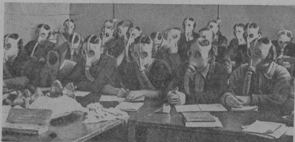
На лекционном занятии во время химической тревоги.