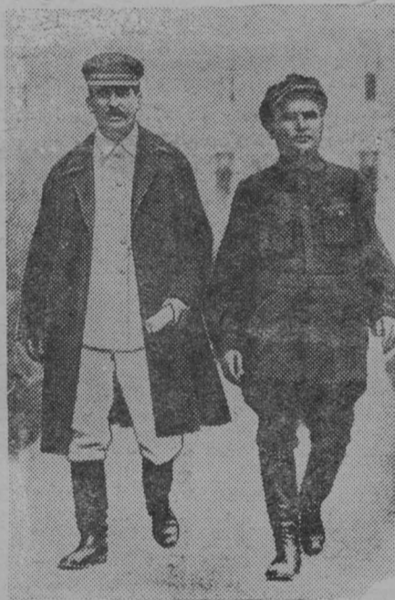
И. В. Сталин и С. М. Киров в 1930 г.

Художник В. Федоров заканчивает картину «И. В. Сталин, С. М. Киров и Г. К. Орджоникидзе в 1920 г.».