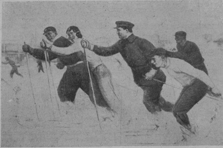
Репродукция картины худ. Дермидонтова.

Физкультурную делегацию С. М. Киров и делегаты партконференции встретили стоя, стоя выслушали они и рапорт. Физ-