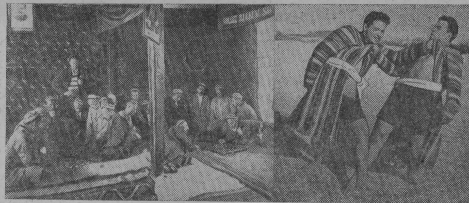
Таджикские колхозники (слева) за игрой в шахматы. Справа — Таджикская борьба

Большевики Таджикистана проделали большую работу в развертывании национальных средств физического воспита-