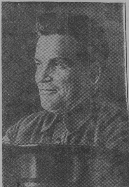
Сергей Миронович Киров

Светлая память незабвенного Мироныча вдохновляет наш коллектив, как и весь советский народ, на новые победы.