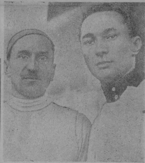
Чемпион СССР по шпаге т. Лебедзинский (Львов) и заслуженный мастер спорта СССР К. Т. Булочко

Заслуженный мастер спорта СССР Н. БУЛОЧКО