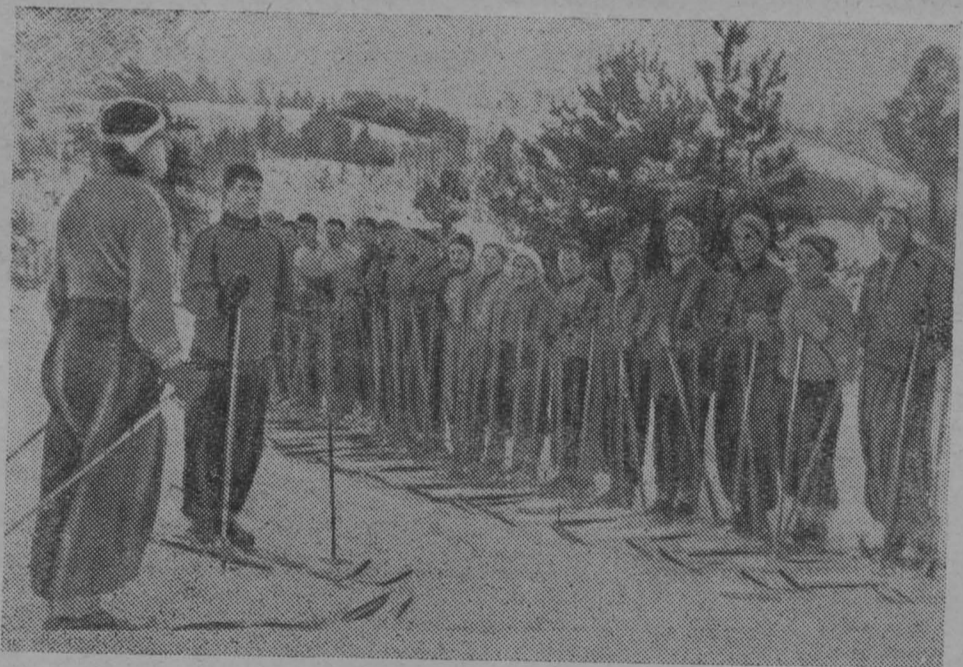
Лыжники-лесгафтовцы на первой тренировке в Кавголово.

(лыжник-доброволец, награжденный медалью «За боевые заслуги»)