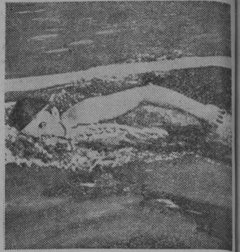
Заслуженный мастер спорта СССР В. Ф. Китаев на дистанции