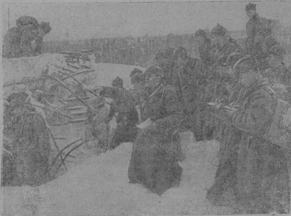
Курсанты слушают рассказ своего командира — участника боев с белофиннами — о боевых действиях Красной Армии, разгромившей доты Карельского перешейка

Дистанция и порядок выполнения упражнений: 25 км, по пересеченной местности. Последние 2 км — в противогазах. После 25 км. — метание гранаты стоя, с лыж, каждым лыжником по одну на дистанцию 25 метров.