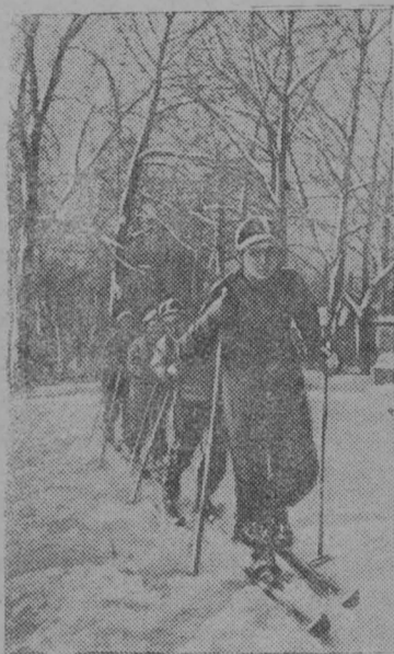
На лыжной тренировке

Наименьшее время, показанное командой на лыжном переходе определяет луч-