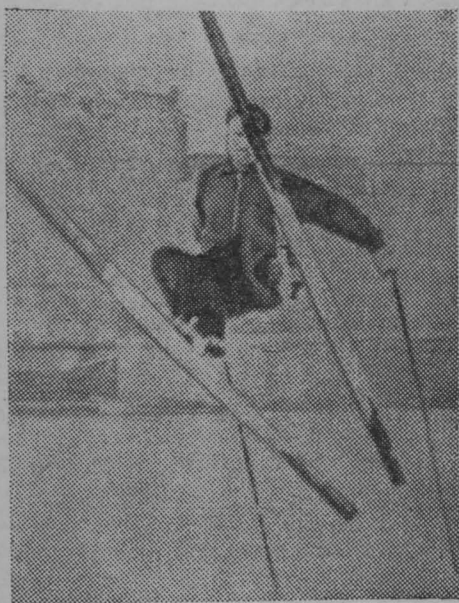
На лыжной тренировке