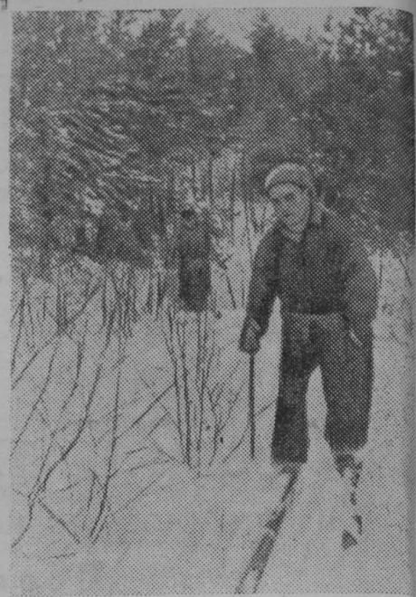
На учебно-тренировочном занятии. Лыжник — в разведке.

(лыжник-доброволец, награжденный медалью «За боевые заслуги»)