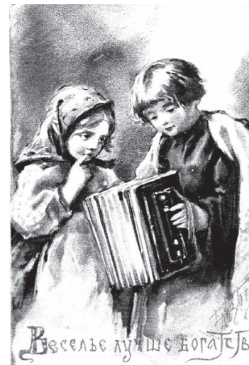
Веселье лучше богатства. Открытка Российской империи. Художник Елизавета Меркурьевна Бём (1843–1914).