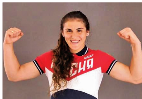
Вольная борьба (до 69 кг). Наталья Воробьева, Олимпийская чемпионка 2012 года, ЗМС России, аспирантка нашего вуза, серебряный призер игр 2016 года.