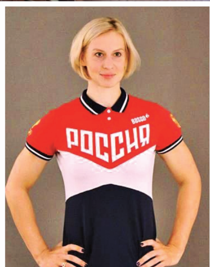
Гандбол. Екатерина Маренникова, игрок национальной сборной России, ЗМС России, выпускница нашего вуза, Олимпийская чемпионка игр 2016 года.