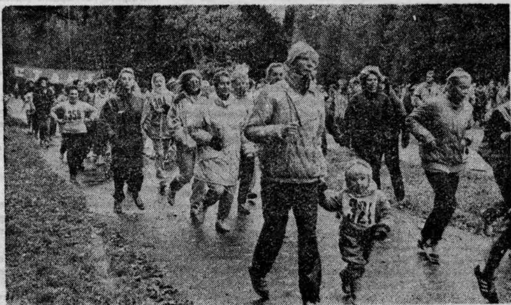
На дистанции кросса (Комментарий о Дне здоровья будет продолжен в следующем номере газеты.)