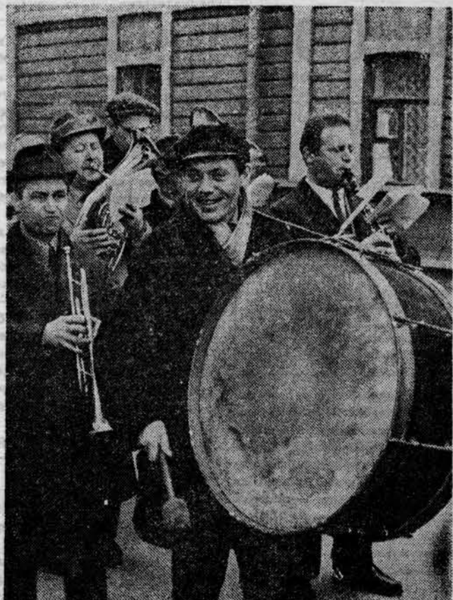
ШЕЛ ПО УЛИЦЕ ОРКЕСТР.