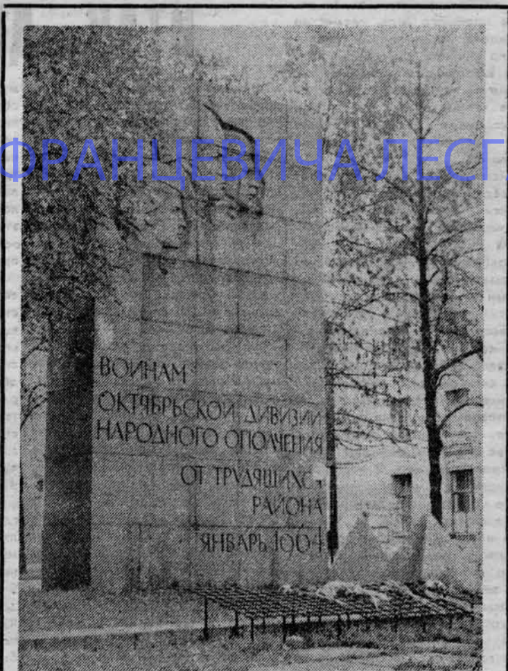
Установленная у здания исполкома Октябрьского райсовета народных депутатов памятная стела в честь подвига бойцов народного ополчения нашего района, грудью заслонивших родной Ленинград от фашистских захватчиков осенью 1941 года на оборонительных рубежах под Красным Селом. В рядах ополченцев сражались и многие студенты и преподаватели нашего института, учащиеся техникума физкультуры.

Вспоминаю обход палат одного из госпиталей на Фонтанке. Идем мимо клубной комнаты и останавливаемся на несколько минут, чтобы послушать выступление молодого черноволосого, стройного актера. Он читал монолог под названием «Черт». Никогда, кажется, ранее не слышал я такого яркого, лаконичного, образного слова. Спрашиваю у начальника госпиталя: — Кто это? — Артист эстрады Райкин. Уже после войны, встречая легендарного Райкина на Кировском проспекте, где он жил, я всегда вспоминал этот блокадный эпизод.