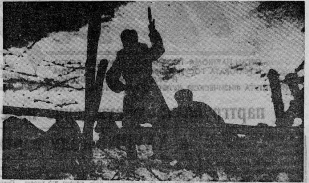
Переход партизан через линию фронта.

и на страницах нашей газеты и в других изданиях. Но тема эта неизбывна, нескончаема. Летопись войны год от года дополняется по крупицам новыми, ранее не известными фактами, именами безымянных героев. И самое бесценное в том, что уже сказано об этом времени и что будет еще узано нами, — это подлинные документы тех дней и свидетельства участников боев. Сегодня именно этим материалам мы отдаем 2 и 3-ю страницы нашей газеты. На 4-й стр. мы публикуем обращение ветеранов к студентам.