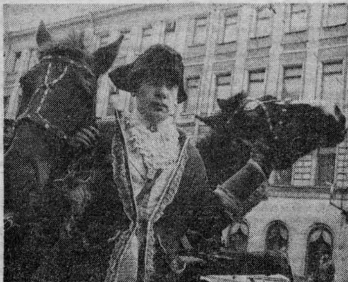
«КОНИ МОИ, КОНИ...»