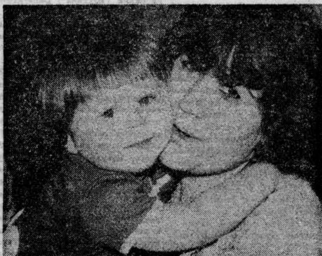
«Мы с мамой...»