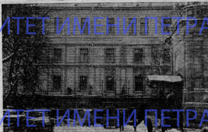
Долгожданный момент: покраска здания окончена, снимают леса.

сообщены в таких работах, как «Телесные упражнения во Франции» (1893 г.), «Шведская педагогическая гимнастика» (1897 г.), «Воспитание и телесные упражнения в английских школах» (1915 г.) и др.