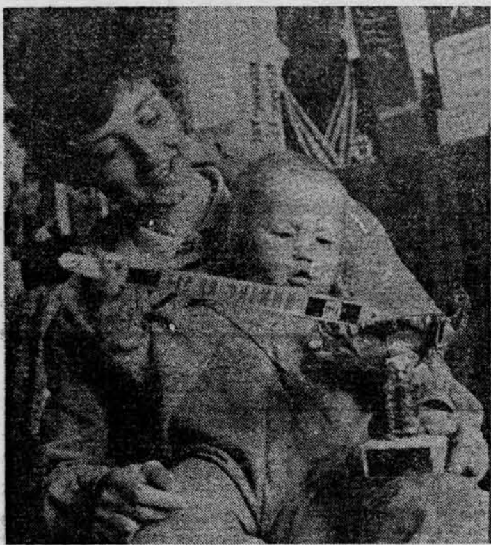
КАК ДЕЛА, ОЛИМПИЕЦ?

Сольвейг! Ты прибежала на лыжах ко мне, улыбувшись пришедшей весной! А. БЛОК