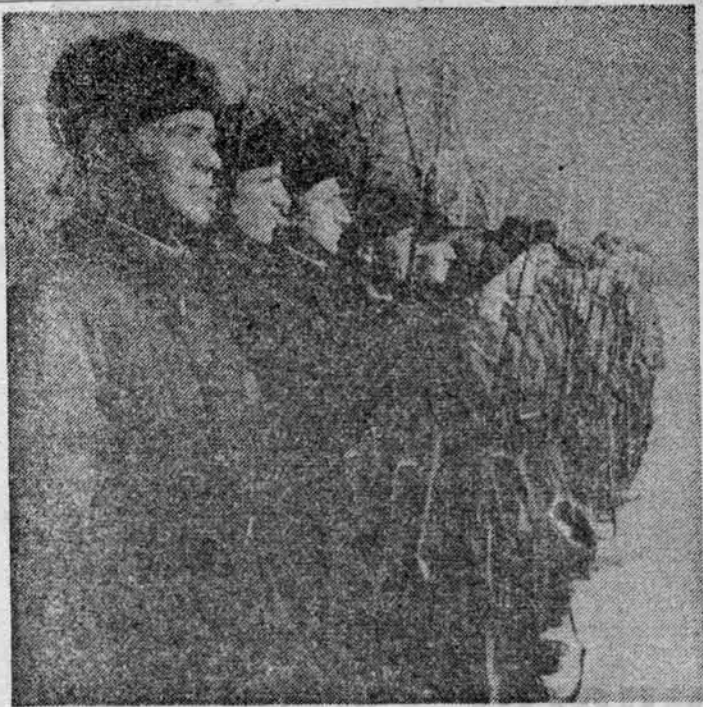
Ленинградские спортсмены — воины Ленинградского фронта на занятии по боевой подготовке незадолго перед отправкой на передовую.