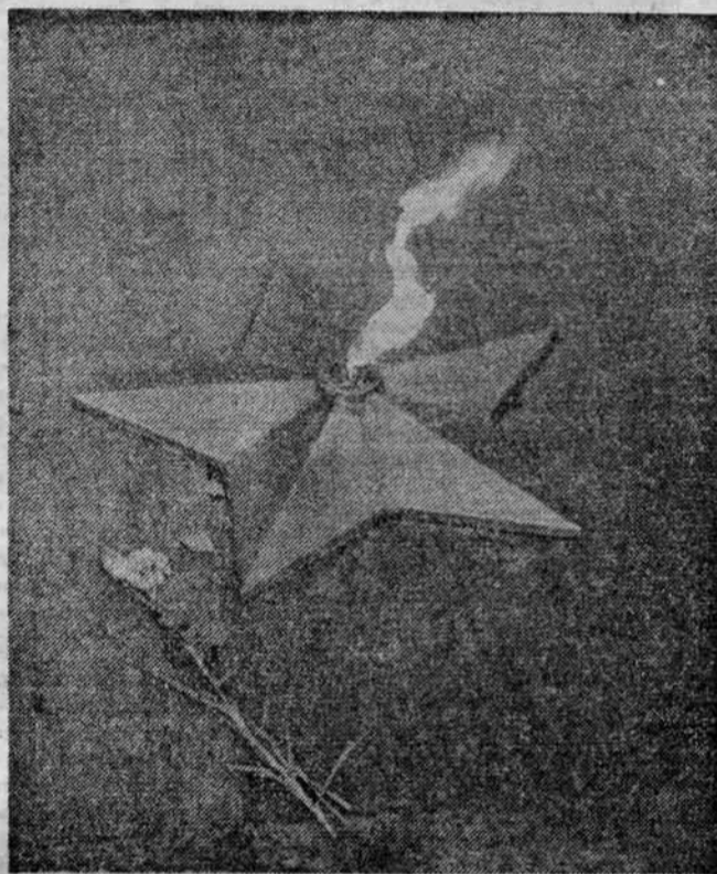
Горит у памятника воинам-лесгафтовцам вечный огонь...