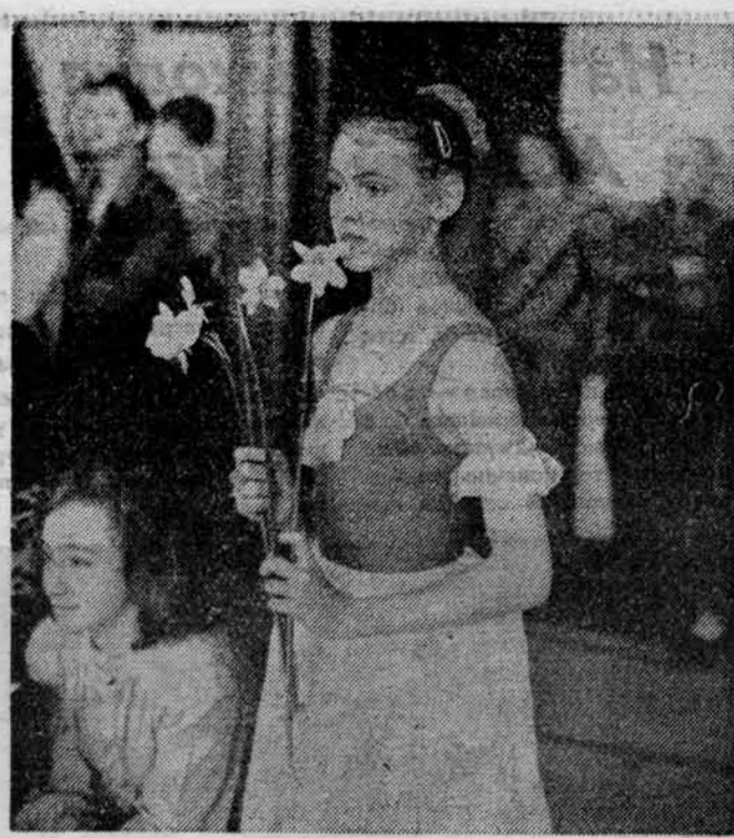
Мгновения триумфа Фотозюды Николая Каплуновского