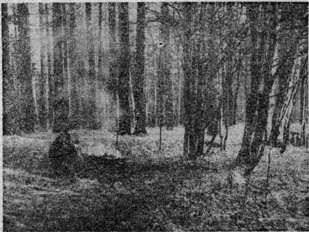
ДЫМОК КОСТРА В ЛЕСУ ВЕСЕННЕМ.