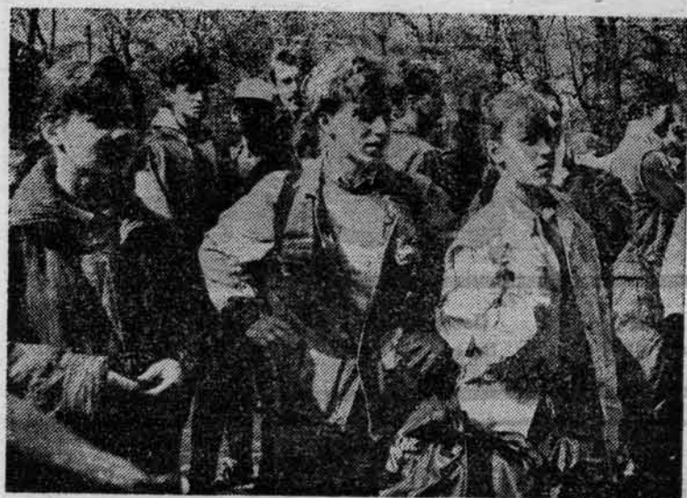
По программе Спартакиады института