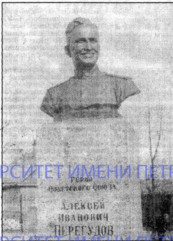
Сын героя, наш выпускник