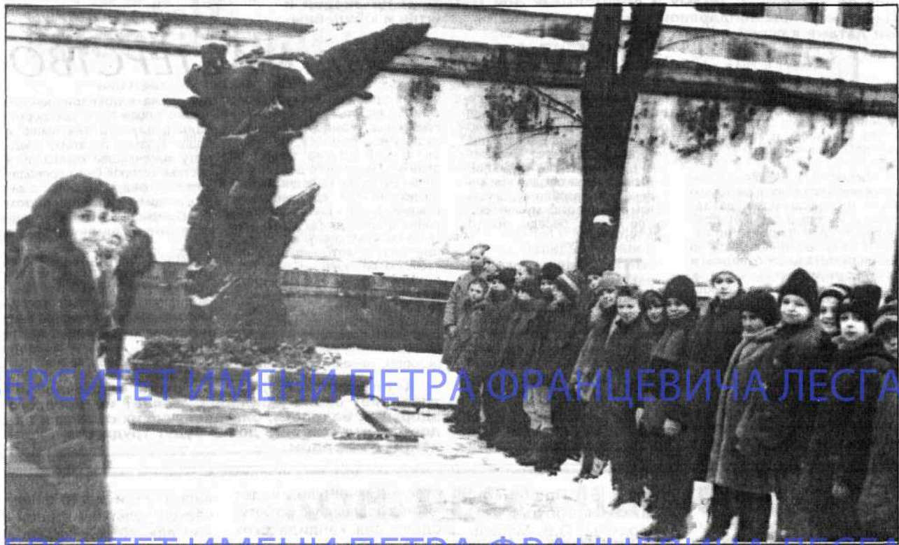
К 95-летию Д.Ф. Косицына