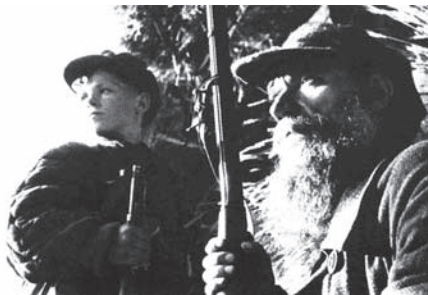
Старики и дети, мужчины и женщины с оружием в руках мстили фашистским оккупантам

Партизаны-лесгафтовцы первыми из ленинградцев начали совершать рейды за линию фронта, начиная с 29 июня 1941 года, буквально в день издания постановления Совнаркома и ЦК ВКП(б) о начале партизанской войны. Как и другие отряды, составленные из ленинградских студентов, лесгафтовцы переходили линию фронта и, выполнив задание, возвращались в Ленинград.