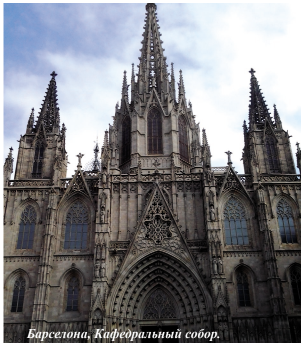
Барселона, Кафедральный собор.