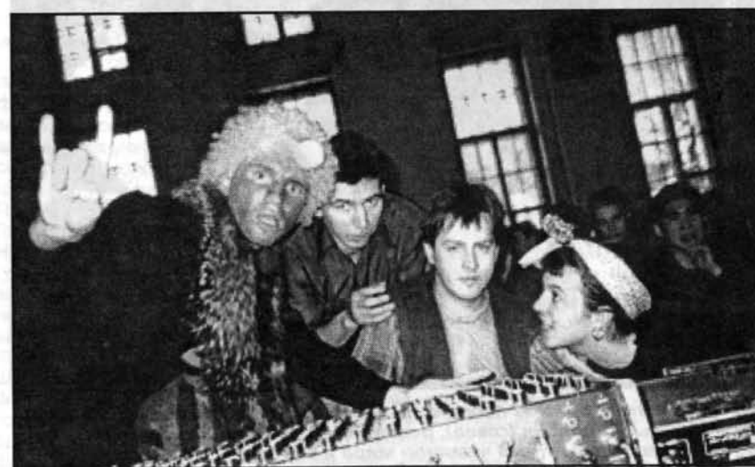
На пульте управления программой вечера