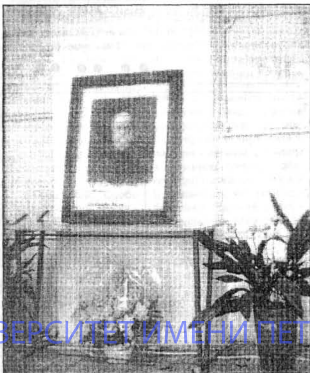
На сцене Актового зала 8 апреля.