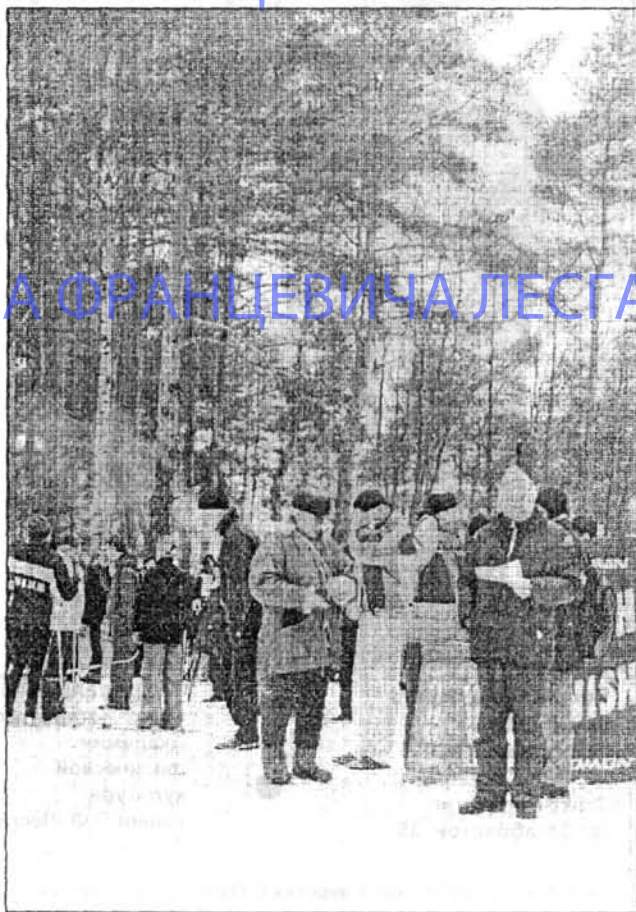
На снимках: на дне здоровья.

УНИВЕРСИТЕТ ИМЕНИ ПЕТРА ФРАНЦЕВИЧА ЛЕСГАФТА