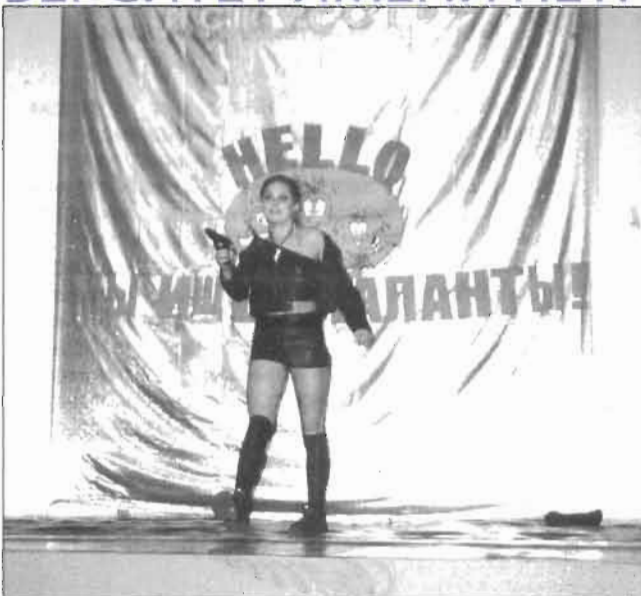
На снимках: выступления участников конкурса

Вот уже несколько лет подряд наша академия принимает участие во Всероссийском смотре-конкурсе самодеятельного студенческого творчества. Подготовка к этому сценическому отчету в разных вузах идет по-разному: где-то весь год специально созданная команда деятельно готовится по всем направлениям, субсидируемая своим учебным заведением, а где-то самые активные и талантливые просто определяются в результате творческих отборов.