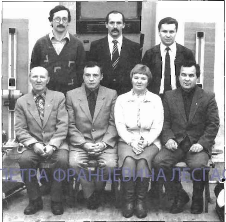
Коллектив сотрудников кафедры бокса 1985 года

В 70-е годы результаты ленинградских боксеров замет-