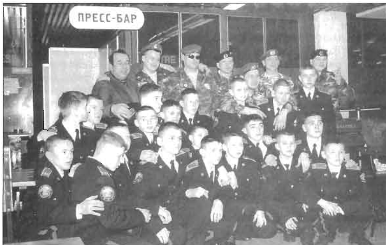
Гости V Всероссийского юношеского турнира по самбо, посвященного памяти «Подвига 6-й роты ВДВ»