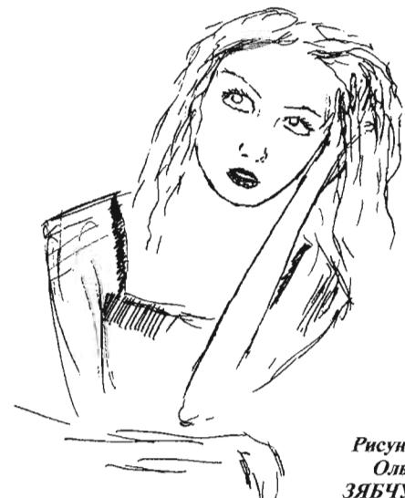
Рисунок Ольги ЗЯБЧУК