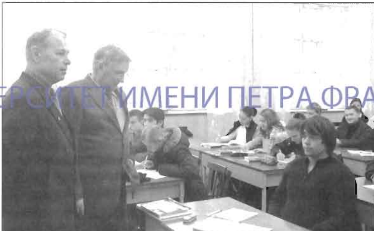
Эксперт из кафедры биомеханики

На основании решения Аккредитационной комиссии Управления лицензирования, аттестации и аккредитации Федеральной службы по надзору в сфере образования и науки, государственное образовательное учреждение высшего профессионального образования "Санкт-Петербургская государственная академия физической культуры имени П.Ф. Лесгафта" признано аттестованным.