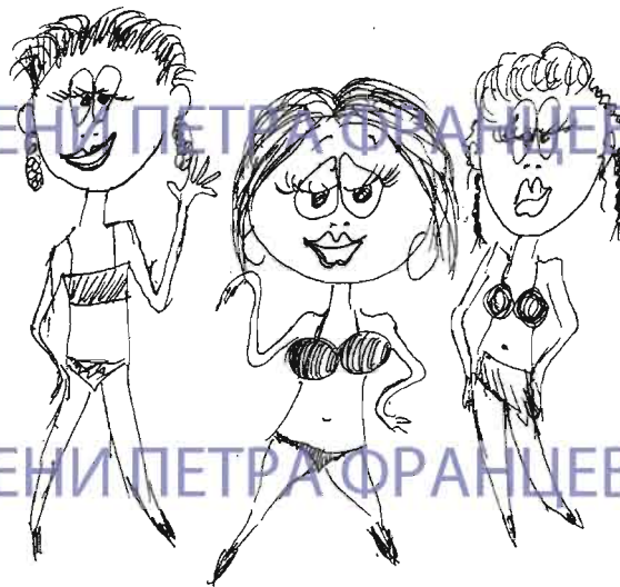
Рисунки Ольги ЗЯБЧУК

Спешите! Заявки принимаются до 12 апреля