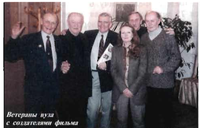
Ветераны вуза с создателями фильма