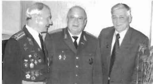
На торжественном вечере можно было пообщаться в теплой дружеской обстановке