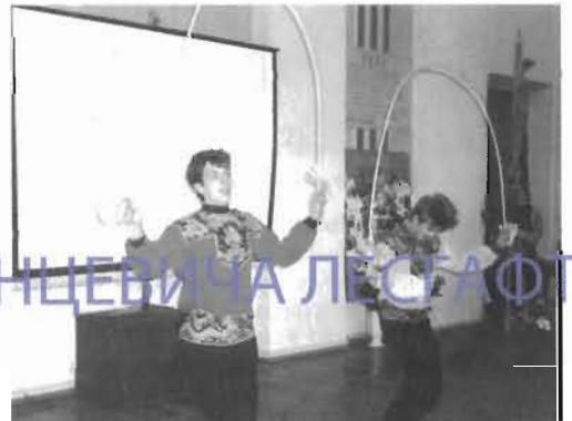
Коллектив народного танца кафедры АФК порадовал зрителей прекрасной композицией