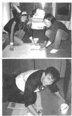
Работа над созданием коллажа «Лесгафтовец»