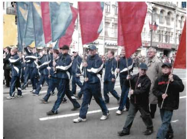
Праздничная колонна ветеранов спорта города и лесгафтовцев на параде в честь 60-летия Великой Победы