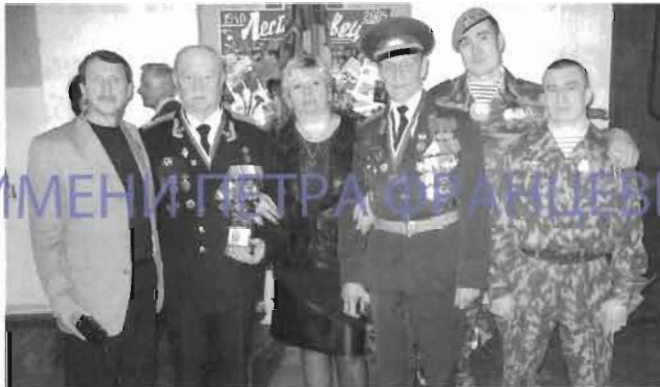
Ассоциация экономического взаимодействия субъектов РФ "Северо-Запад" и ООО "Диалог-Конверсия СПб" приняли участие в фестивале ветеранов Академии. Были вручены юбилейные медали, грамоты и памятные подарки