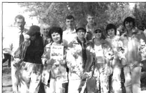
Делегация нашего вуза на открытии Фестиваля