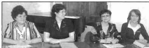
Сотрудники отдела кадров свою работу вышленили на «отлично»