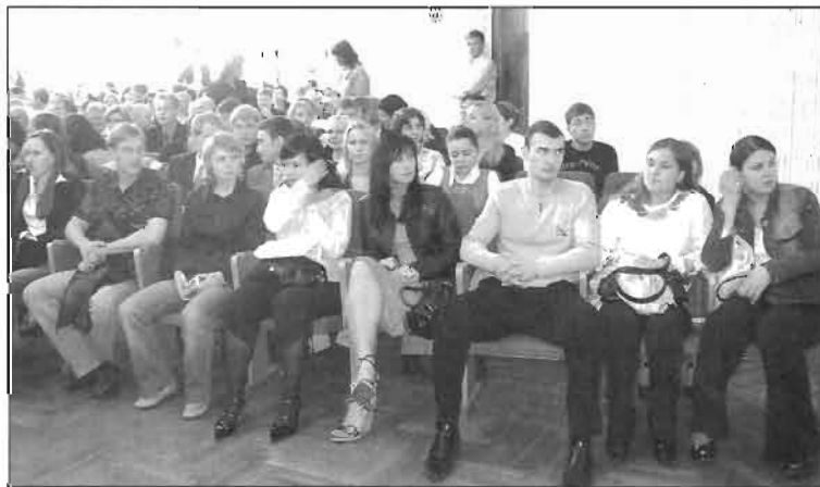
Без пяти минут дипломированные специалисты