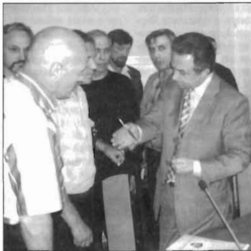
(Окончание. Начало на 1 стр.)

Подростками совершаются более 200 тысяч правонарушений. Если мы сейчас не займемся оздоровлением нации, то неизбежно потеряем наш генофонд. Отраднo, что президент В.В. Путин понимает необходимость инвестировать здоровый образ жизни. Поэтому мы рассчитываем на его поддержку и понимание.