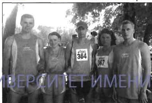
Участники спортивных соревнований IX Студенческого фестиваля

фестивалях, можно отметить, что победы и призовые места достаются нам в условиях постоянно возрастающей конкуренции. Если первые фестивали 90-х годов больше соответствовали своему названию и были направлены на укрепление дружбы и обмен опытом студентов и преподавателей физкультурных вузов страны, то теперь эти фестивали фактически превратились в чисто спортивное мероприятие с учетом очков и секунд. А это, в свою очередь, ведет к рабобожению профессионалов, ошибкам в работе жюри и судейских коллегий, предвзятости и откровенному засуживанию участников. Именно эти факторы не позволили нам занять призовые места в некоторых номинациях Фестиваля.