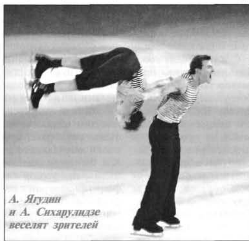
А. Ягудин и А. Сихарулидзе веселят зрителей