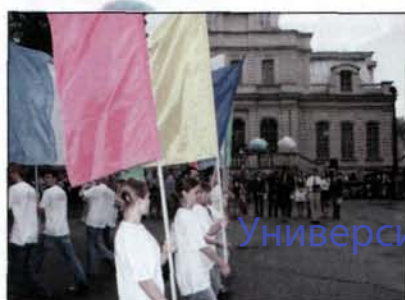
Университет Петра Францевича Лесгафта