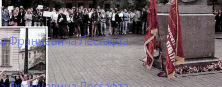
Университет Петра Францевича Лесгафта