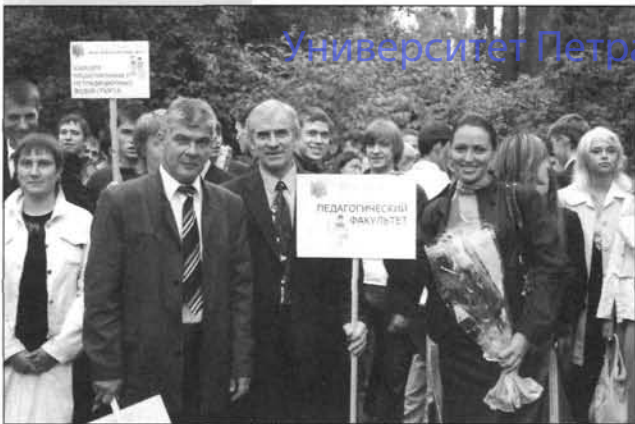
На торжественной линейке 1 сентября 2006 года

И только в 1932-33 уч./году в вузе перешли на факультетскую систему образования, и были открыты кроме педагогического, организационно-методический