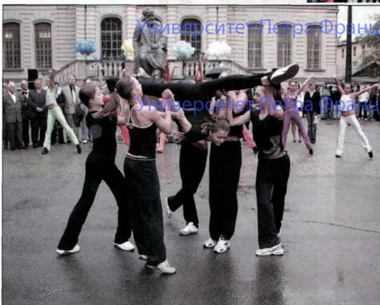
Университет Петра Францевича Лесгафта