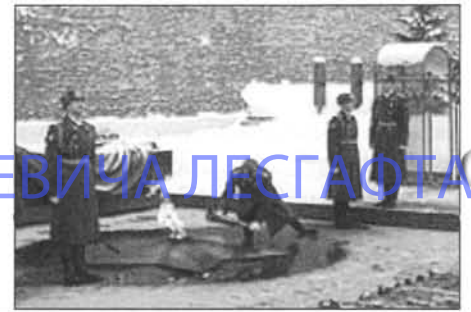
Зажжение факела в Москве у могилы Неизвестного солдата.