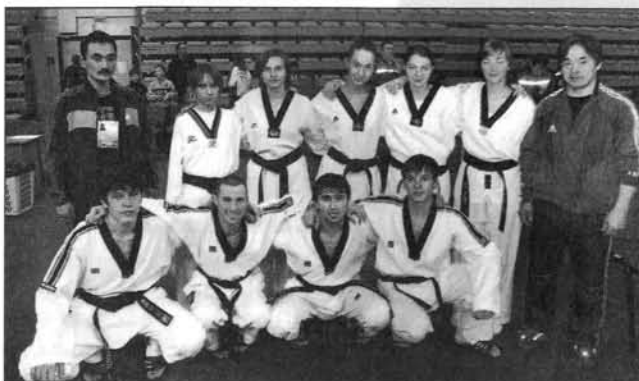
Сборная команда Санкт-Петербурга