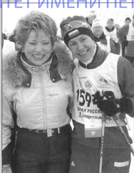
На «Лыжне России» — губернатор Санкт-Петербурга В. И. Матвиенко и Л. И. Егорова