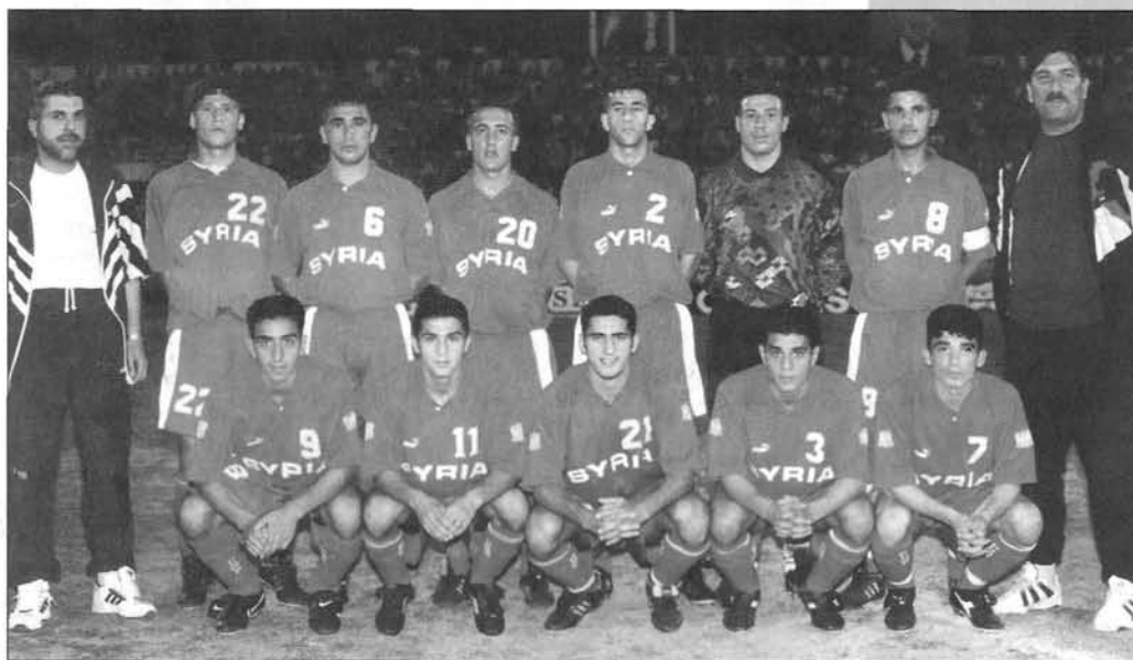
Сборная Сирии по футболу на молодежном чемпионате Азии в 1998г.

For detailed information about the St Petersburg state university of physical culture named after P.F.Lesgaft in English and German visit www.lesgaft.spb.ru