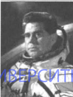
Г. Т. Береговой (15 апреля 1921 г. — 30 июня 1995 г.)

Г. Т. Береговой — летчик-космонавт, был награжден двумя орденами Ленина, двумя орденами Красного Знамени, орденами Александра Невского 3-й степени, двумя орденами Красной Звезды, двумя орденами Отечественной войны 1 степени, медалями. Награжден золотой медалью имени К. Э. Циолковского АН СССР, золотой медалью имени Ю. А. Гагарина (FAI).