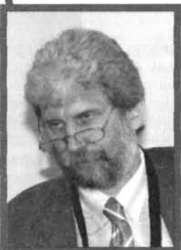
Александр Владимирович Малинин