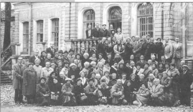
1987 год. Встреча выпускников 1957 года.

парада физкультурников в Москве, а в 1957 году — на Всемирном фестивале молодежи и студентов. Участие в этих крупнейших мероприятиях, общность цели объединили нас, внесли в нашу дальнейшую жизнь животворный дух товарищества, преданности институту, Ленинграду.